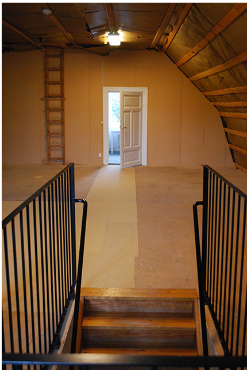
En av dessa var Institutionen för Öst- och Centraleuropastudier. Här fick jag

Början på min anställning vid Lunds universitets arkiv sammanföll med en stor organisatorisk förändring inom Humanistiska fakulteten. En rad små, enskilda språkinstitutioner skulle läggas ned och i stället återuppstå i en ny storinstitution: Språk- och litteraturcentrum, förkortat SOL. Och inför detta skulle alla de berörda gamla institutionernas arkiv avslutas och samlas in. Därigenom kom min första vår i universitetets tjänst att i stor utsträckning att tillbringas i en rad av intressanta källare, vindar, prång och skrubbar i allehanda mer än hundraåriga villor i Professorsstaden, ty där hade många av dessa språkämnar dittills haft sina hemvister.